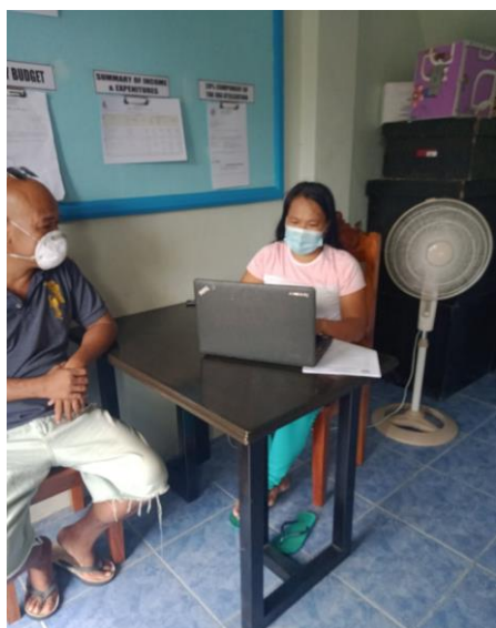
活用風景②村役場（証明書作成）