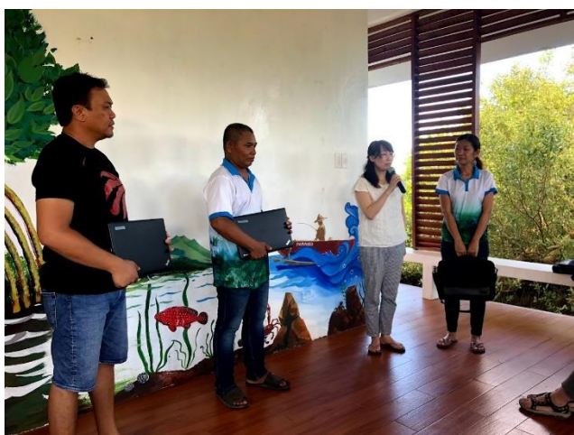
2019 年 6 月 PC 寄贈式

マングローブ環境公園のスタッフの方は、これまで PC を使った仕事をしたことがありませんでした。そのため、PC 寄贈により、PC のスキルを学ぶ良い機会にもなったようです。現時点では簡易なレベルでの活用にとどまっているようですが、これから PC を活用して事務作業を更に効率化させていきたいと考えられていらっしゃるようです。