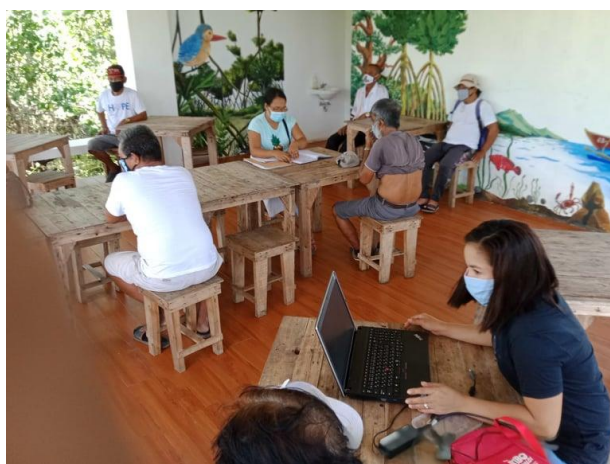
活用風景① マングローブ環境公園