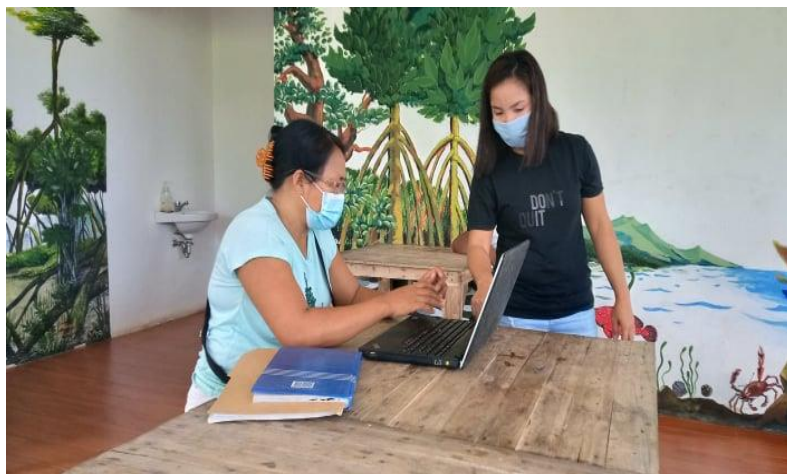
活用風景③会計書類の入力練習